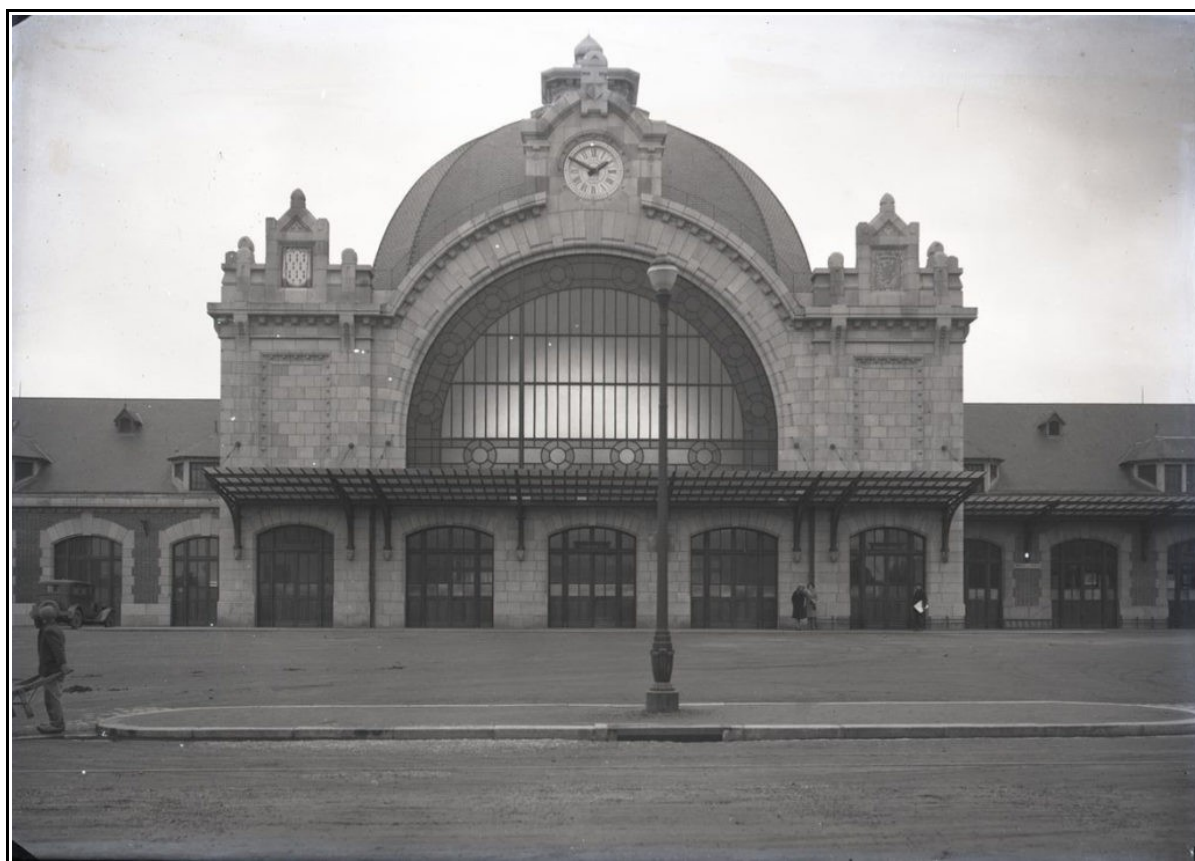
Vue de la gare de Saint-Briec sur plaque de verre – Vers 1931 par Lucien Bailly. Collection du Musée d'Art et d'Histoire de Saint-Briec.

Dans le cadre d'un concours organisé par la SNCF, la gare de Saint Briec est arrivée en première position devant Rennes et Lorient, elles sont désormais toutes trois en lice pour le concours national.